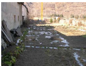
Horts Esterri d'Àneu afectats per la construcció urbanística

S'ha recollit llavors de Araós (casa de Millet), Àreu (casa Besolí), Caregue (casa Jaumet), Casibró (casa Arnau), Estaís (casa Poblador), Esterri d'Àneu (casa Rosendu, casa Carmeta, casa Nadal, casa Martinez), Gerri de la Sal (casa Gassa), La Bastida (casa Campa), Sort (borda de Botja), Pujol (casa Vilanova), Seurí (casa Font, casa Llacai), Sorpe (casa Armengol, casa Cairilla, casa Mainet) i Son (casa Moreu). Són un total de 14 pobles i 19 cases.