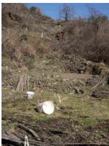
Vistes d'hortos d'Araós