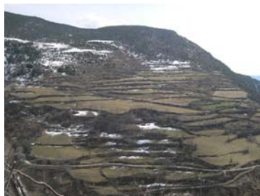
Parcel·les davant del poble