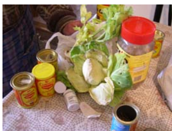
Pots de llavors

All (vermell i blanc), api (verd, mureno i sense nom), carbassa (cabell d'àngel, pasteque, rabequet, rabequet xica, de concurs, groga, verda), carbassó (sense nom i de córrer), ceba dolça, clavellines vermelles, col (comú, de ruc), enciam (negre, verd, mureno, verd llarg o carxofet), escarola (doble de verano, semblant cabell d'àngel), fava, fesol o mongeta (perona, afartapobres, mantega, mata baixa, tavella, quarantens, redó, emparrador, de mongeta, varis sense nom, negre, marronet, del cuc, del tros, tavella redona, baixa de l'hort, vells, roní, procedent del pont de montanyana, roi, avellaneta, de França), pèsol (nanu o gran), remolatxa (comú farratgera), tomàquet (de molt bona mena, de tot l'any, de guardar, palosanto, popa de vaca, normal, llargueta, rodona, rosa).