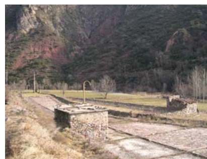
Viver de Gerri de la Sal

Com a mínim es suggereix de sembrar 12 individus per varietat si vol que sigui representatiu, i de les espècies al·lògames és recomanable guardar llavor de 30 individus diferents.