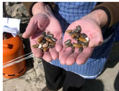
Diferents varietats de fesol d'emparrar. Pepita, Casa Besolí, Àreu